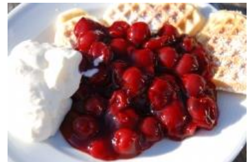
Waffelherzen mit Kirschkompott