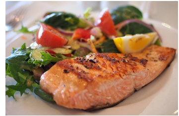
Lachsfilet gebraten an Gartensalat