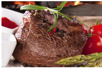
Rindersteak mit Grünspargel